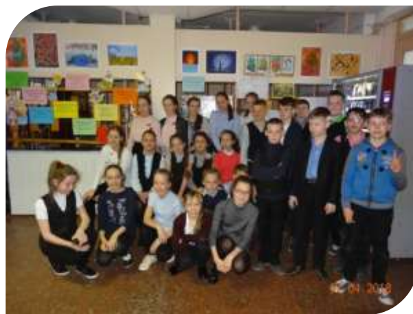
Ваш 5 Б класс.

Закончилось наше дежурство, опустела Поляна сказок. Но мы-то знаем... В сказке радость побеждает, Сказка учит нас любить. Может быть, на этом свете Станет легче людям жить.