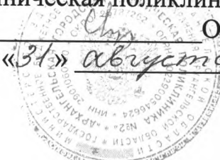
График работы медицинского работника в МБОУ МО «Город Архангельск» «Средняя школа № 36»:

Понедельник 8.30 – 16.42 Вторник 8.30 – 16.42 Среда 8.30 – 16.42 Четверг 8.30 – 16.42 Пятница 8.30 – 16.42