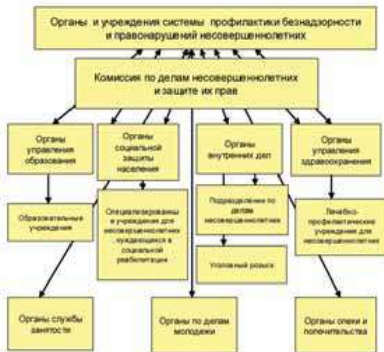
СХЕМА ОРГАНОВ И УЧРЕЖДЕНИЙ СИСТЕМЫ ПРОФИЛАКТИКИ БЕЗНАДЗОРНОСТИ И ПРАВОНАРУШЕНИЙ НЕСОВЕРШЕННОЛЕТНИХ (ФЕДЕРАЛЬНЫЙ ЗАКОН ОТ 24 ИЮНЯ 1999 Г. № 120-ФЗ «ОБ ОСНОВАХ СИСТЕМЫ ПРОФИЛАКТИКИ БЕЗНАДЗОРНОСТИ И ПРАВОНАРУШЕНИЙ НЕСОВЕРШЕННОЛЕТНИХ»)